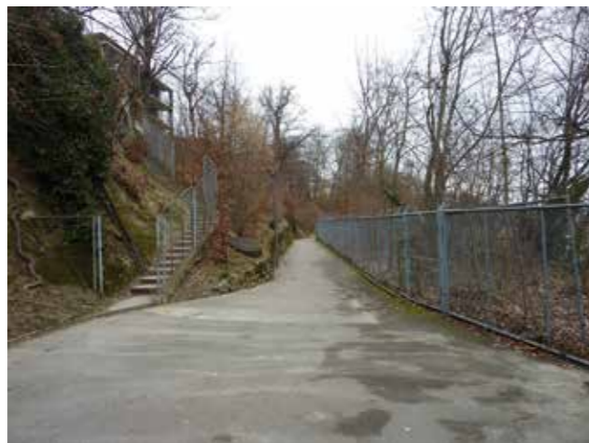
La Promenade du Bois-de-Beaulieu et ses grillages.